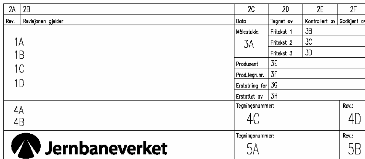
Figur 2.2 Tittelfelt for tekniske tegninger i prosjekter