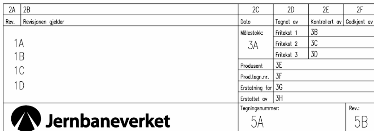
Figur 2.1 Tittelfelt for tekniske tegninger