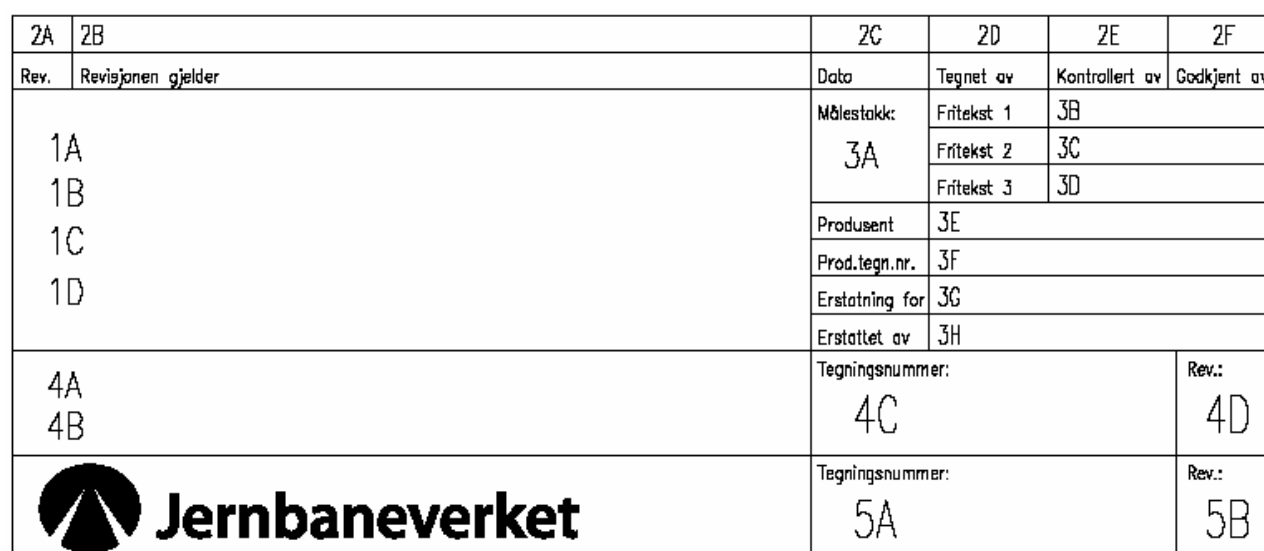
Figur 2.2 Tittelfelt for tekniske tegninger i prosjekter