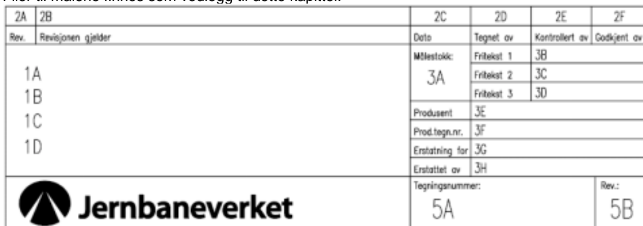
Figur 2.1 Tittelfelt for tekniske tegninger

Filer til malene finnes som vedlegg til dette kapittel.