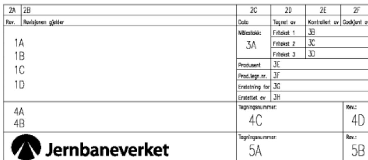
Figur 2.2 Tittelfelt for tekniske tegninger i prosjekter