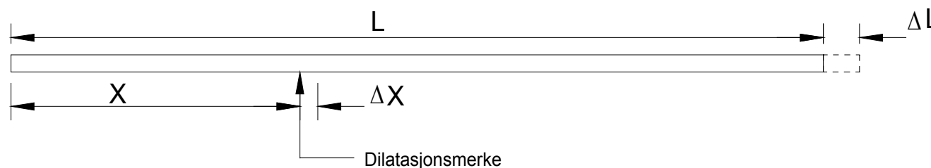
Figur 6o.2 dilatasjonsmål

Dilatasjonsmålene (figur 6o.2) regnes ut etter formel 6.2.